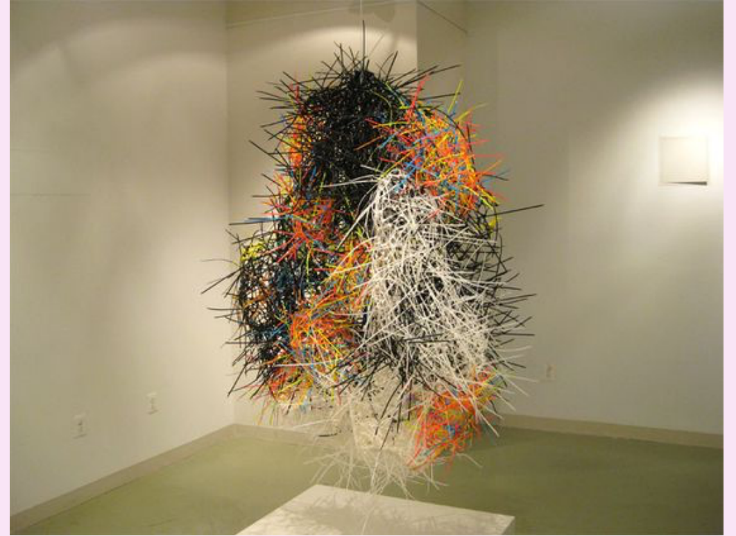
Edmond van der Bijl